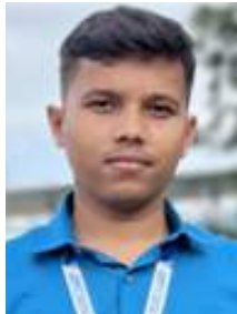
ଜୀବନ ଜ୍ୟୋତି ପ୍ରିୟଦର୍ଶନ