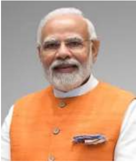
ନରେନ୍ଦ୍ର ମୋଦୀ ପ୍ରଧାନମନ୍ତ୍ରୀ