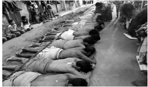
Devotee performing Danda rituals