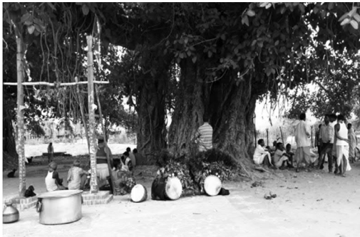
Meru Pole after meru festival