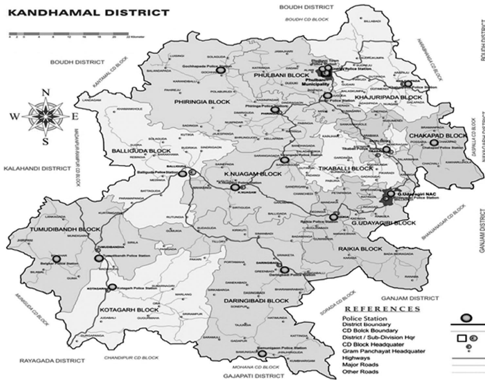
Map of Kandhamal & Study Area

For this present proposed study I undertook two places of Kandhamal district I.e. Dubagarh Village and Narayani Sahi of Phulbani town. Dubagarh village is situated 13 Kilometer away from the Phulbani Town. I took Dubagarh village as a base village and for the purpose of comparative study I took Phulbani town. In my view, those both are multi-ethnic composed areas helped me for better understanding as well as for comparison of field data.