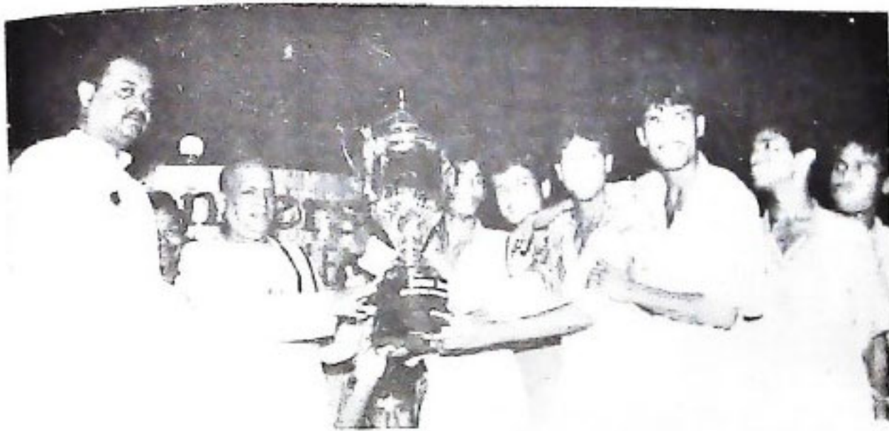
ବିନୋଦ ପାଲ ହସ୍ତେ କଳରୁ ମୁଖ୍ୟମନ୍ତ୍ରୀ ଶ୍ରୀ ନାମକୀ ବରଲ ପଟ୍ଟନାୟକ ଧର୍ମ ବ୍ୟାଚରଣର ଚତୁ ପ୍ରଦାନ କରୁଛନ୍ତି (୭/୨/୧୯୯୮) ।