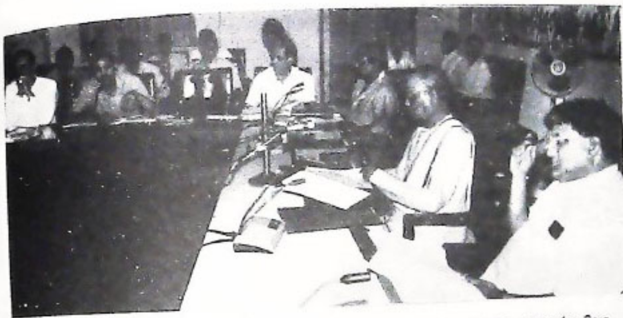
ଉତ୍ତିରାକଳ୍ପରେ ଆୟୋଜିତ ଏକ ଉଚ୍ଚତରୀୟ ବୈଠକରେ ମୁଖ୍ୟମନ୍ତ୍ରୀ ଶ୍ରୀ ନାମକୀ ବରଦ୍ଧ ପଟ୍ଟନାୟକ ଆଉ ରାଜ୍ୟ ସୀମା ବିବାଦ ପତ୍ତନରେ ସମାଧାନ କରୁଛନ୍ତି (୧୨/୬/୧୯୯୮) ।