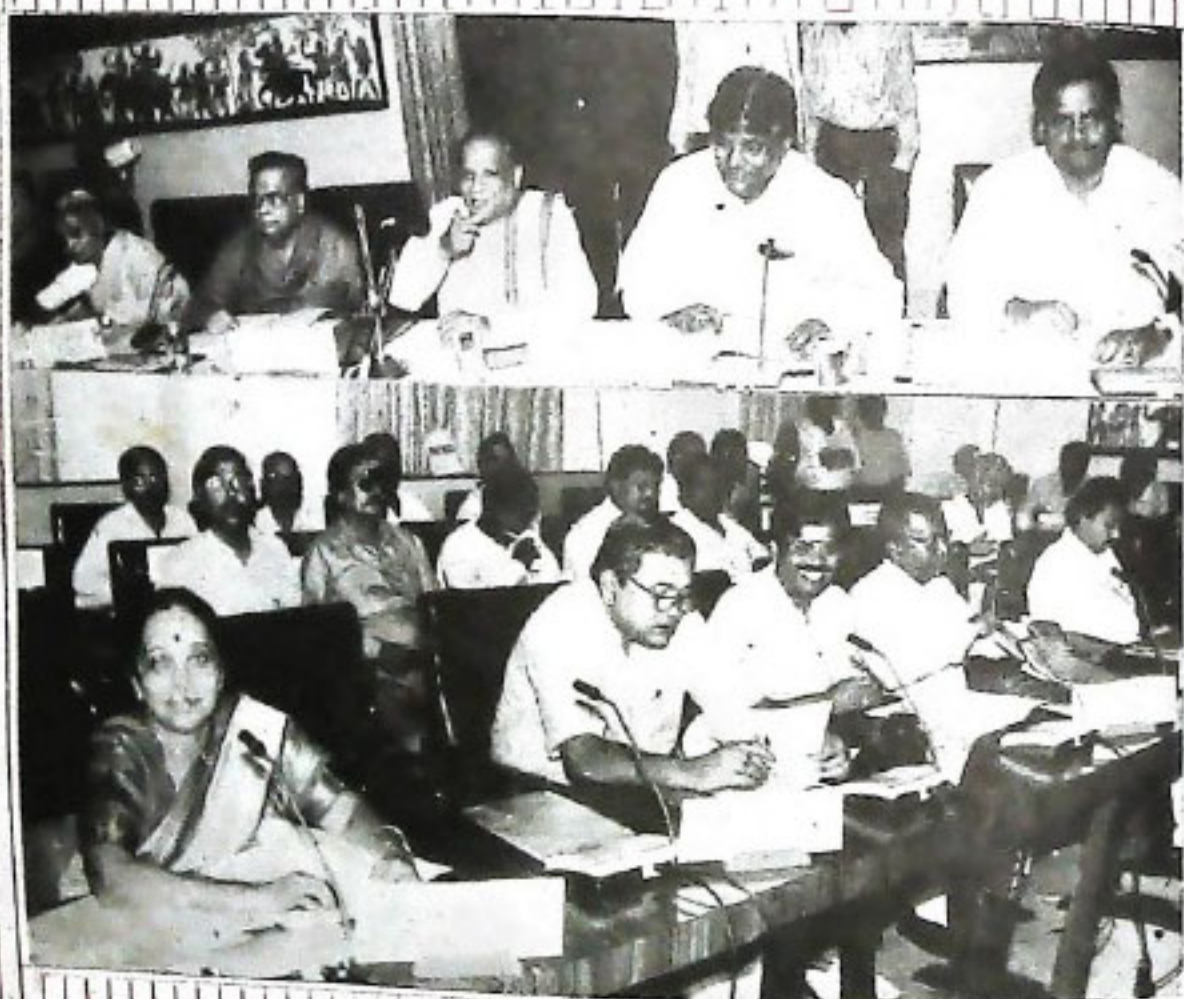
ପରିବାହଣ ପଣ୍ଡିତା ଉପରେ ଆୟୋଜିତ ରାଜ୍ୟସ୍ତରୀୟ ପ୍ରାକୃତିକ ବିପର୍ଯ୍ୟୟ କମିଟି ବୈଠକରେ ପୁଣ୍ୟନିତୀ ଶ୍ରୀ ଚାନ୍ଦା ବଲ୍ଲ ପଟ୍ଟନାୟକ ଅଧ୍ୟକ୍ଷତା କରୁଛନ୍ତି (୨୭/୭/୧୯୯୮) ।