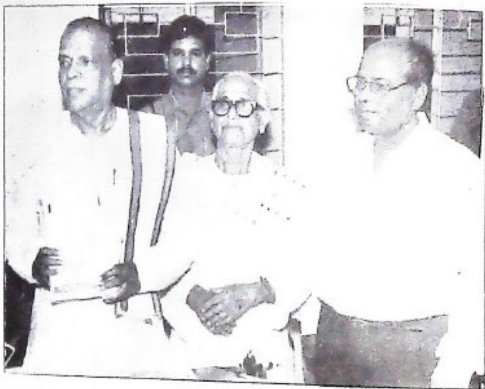
ଓଡ଼ିଶା ସାଂସ୍କୃତିକ ପ୍ରମୁଖ୍ୟାନ ଚଳଚ୍ଚିତ୍ର ସଂଗଳିତ ଓ ପ୍ରକାଶିତ ପଠାଣୀ ସାମଗ୍ରୀଙ୍କ 'ପିତାତପସ୍ୟା' ପୁସ୍ତକକୁ ପୁସ୍ତକାଳୟ ଶ୍ରୀ ଚାନ୍ଦି ବକ୍ସ ପଞ୍ଚାୟତ ଉନ୍ନୟନ କମିଟି (୧୦/୨/୧୯୯୮) ।