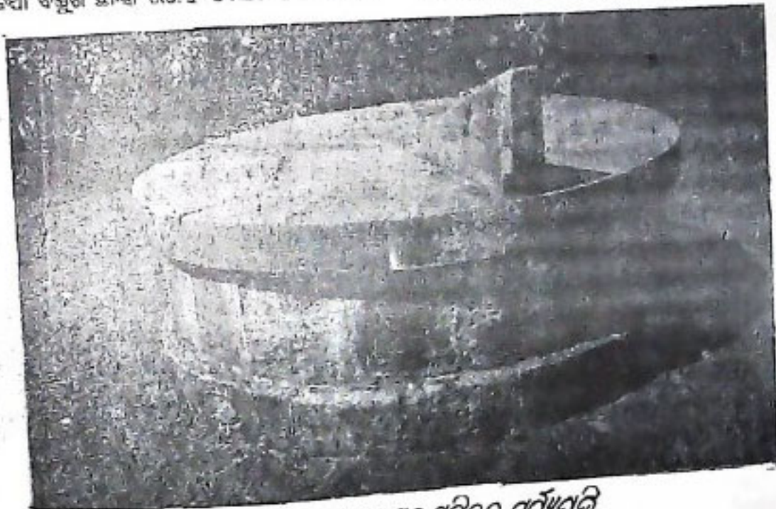
ଭୂସମତଳୀୟ, ଭୂଲମ୍ବୀୟ ଓ ବିଷୁବରେଖୀୟ ସୂର୍ଯ୍ୟଘଡ଼ି

ଆମ ରାଜ୍ୟରେ ଏବେ ସୁଦ୍ଧା ଅନେକ ସ୍ଥାନରେ ସମ୍ପୂର୍ଣ୍ଣ ବିଦ୍ୟା ଆଂଶିକ କାର୍ଯ୍ୟକ୍ଷମ ଅବସ୍ଥାରେ ବହୁ ପ୍ରାଚୀନ, ଏଐତିହାସିକ ଅଥଚ