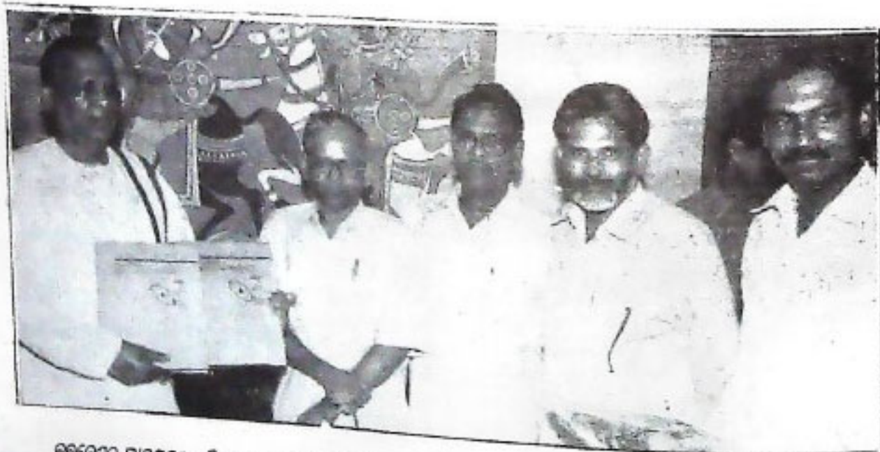
ଭୁବନେଶ୍ୱର ସାମାଜିକ ପ୍ରତିଷ୍ଠାନ ଚଳଚ୍ଚିତ୍ର ପ୍ରକାଶିତ ବିଶେଷ ସାମାଜିକ ପ୍ରସଙ୍ଗ ଶାସ୍ତ୍ର ଓ ଦ୍ୱିତୀୟ ଶତକ ପୁସ୍ତକାଳୟ ଶ୍ରୀ ଚାନ୍ଦି ବକ୍ସ ପଞ୍ଚାୟତ ଉନ୍ନୟନ କମିଟି (୧୦/୨/୧୯୯୮) ।