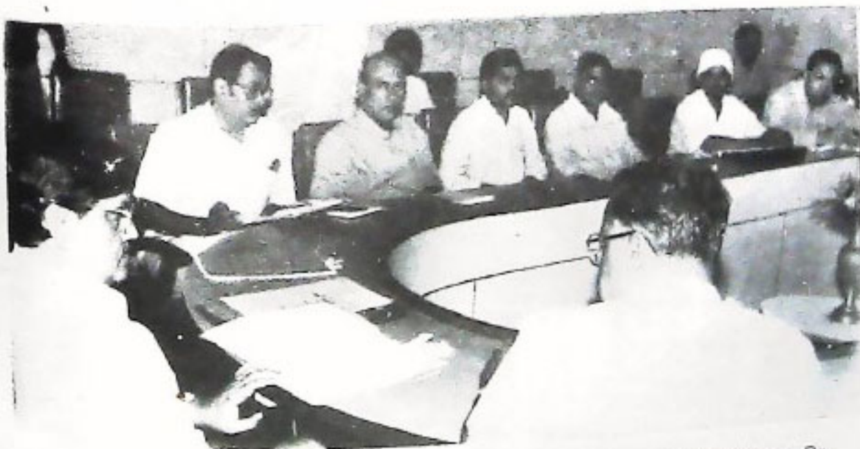
ଉତ୍ତିରାକଳ୍ପ ସମିଳନୀ ଗ୍ରହଣେ ଆୟୋଜିତ ରାଜ୍ୟତରୀୟ ଉପାଦେୟ କମିଟି ବୈଠକରେ ମୁଖ୍ୟ ଶାସନ ଉଚ୍ଚ ଶ୍ରୀ ସୁଧାଂଶୁ ଭୃଷଣ ମିଶ୍ର ଅଧ୍ୟକ୍ଷତା କରୁଛନ୍ତି (୧୯/୬/୧୯୯୮) ।