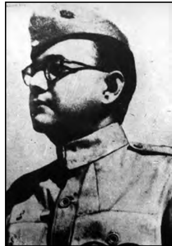
ନେତାଜୀ ସୁଭାଷ ବୋଷ